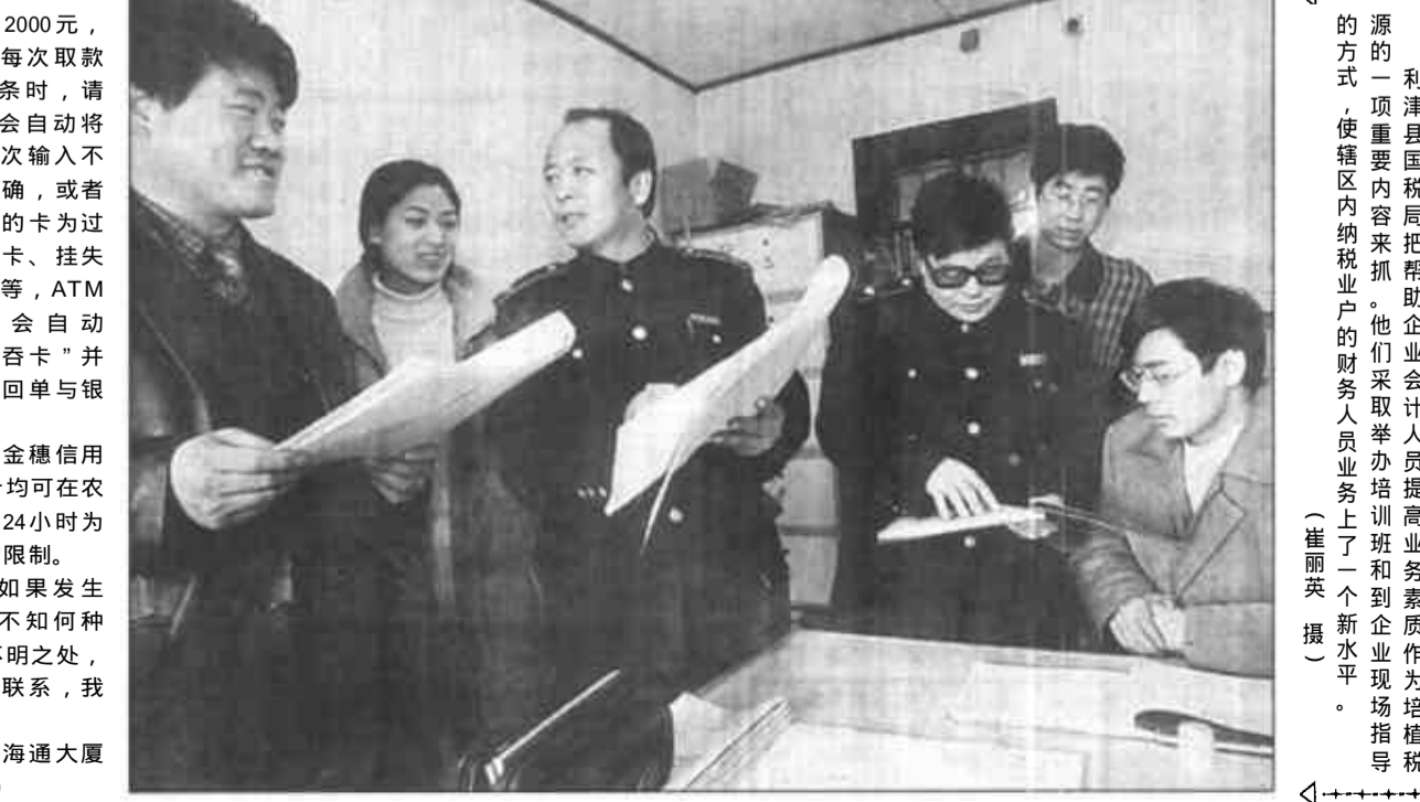
源的一项主要内容来抓。他们采取举办培训班和到企业现场指导的方式，使辖区内内纳税户的财务人员业务上上了一个新水平。

源的一项主要内容来抓。他们采取举办培训班和到企业现场指导的方式，使辖区内内纳税户的财务人员业务上上了一个新水平。 (崔丽英 撰)