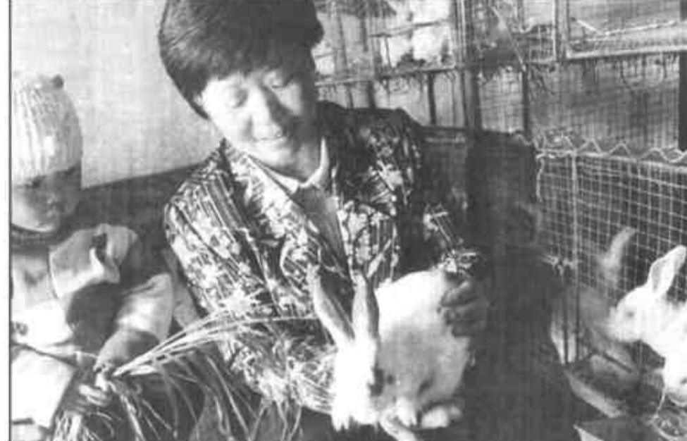
海中村开展“双思”教育再迈致富大步

使全村家家户户都有致富门路。 海中村通过发展村办企业和个体私营经济致富后，村集体家底厚实了，钱该往那里花？村两委结合对农民开展“致富思源，富而思进”教育，大力兴办社会福利事业。一是投资80万元建起了教学楼；二是投资80万元对村内道路全部进行硬化，水泥公路全村通；三是为家家户户安装了自来水管；四是村里每个儿童出资200元办理了幸福保险；五是对全村60岁以上的老人每月发放30元生活补助金；六是全村实行面粉免费供给制(每人每月15公斤)；七是投资120万元建起村文化大院，投资200万元建起村公园，使村民有学习、娱乐的休闲场所；八是规划建设高标准的海中新村，已有22户农民搬进了新村。海中村在“富而思进”中，与周围几个村联合办起了谊海化工厂，大型的面粉加工厂。最近，他们又新上了白炭黑项目，该项目建成后，预计新增产值1000万元，年新增利税150万元。“富而思进”使海中村正向更高的目标迈进。 (王文元 王金一)