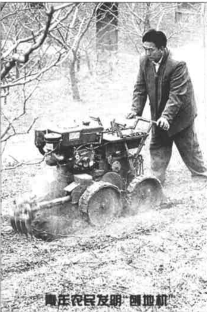
枣庄农民发明“刨地机”

会议听取了对外贸易经济合作部部长石广生作的国务院关于我国加入世界贸易组织进展情况的报告。今天的会议还审议了全国人大常委会代表团访问澳大利亚、斐济、汤加和新西兰四国情况的书面报告。